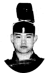
宮 司 背古 宗敬

今年も秋晴れの下、三五四會の威勢の良い掛け声とともに御神輿が浦幌町内一円を練り歩きました。昭和三十三年、氏子等によって二基目となる新しい御神輿が奉納されてより今年で五十回目の節目となる神輿渡御も盛大にご奉仕させて頂きました。各町内温かいお出迎えを賜りました事心より厚く御礼申し上げます。先人が浦幌町の五穀豊穰と繁栄を祈り、氏子町民の願いを乗せて担いできた御神輿への想いが昔も今も変わる事無く引き継がれております。私事ではありますが、私も祖父から三代同じ想いで神輿渡御にご奉仕させて頂いております。氏子の手で護り、世代から次の世代につないできたこの伝統行事、昨今の厳しい時勢ではありますが、氏子の皆様とともに、この御神輿の重みをしっかりと次世代へ担ぎつないでいく心を大切にしたいと思います。