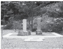
社殿横にお移した社日碑

工事では(株)北栄運輸様・(有)大山庄設様・下坂塗工店様・太平洋レミコン(株)浦幌工場様のご協力を賜りました。心より感謝申し上げます。